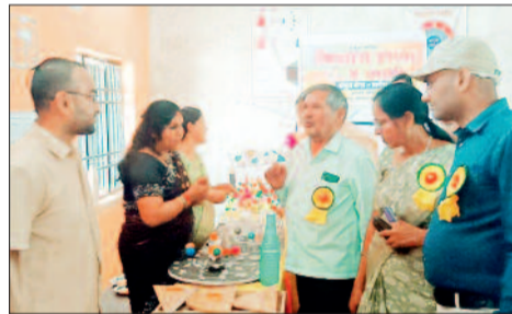
अवलोकन करते हुए शिक्षकों का साक्षात्कार करते हुए उत्साहवर्धन किया और कक्षाओं में नियमित रूप से लागू करने