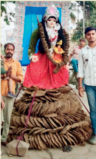
भाटापारा। नगर में होली का त्योहार हर्सोल्लास के साथ मनाये जाने को लेकर लोग तैयारियां कर रहे हैं शहर के विभिन्न इलाकों में 2 मार्च को देर रात होलिका दहन किया जायेगा इसी को लेकर परशुरामवाडी सिटी सेंटर माल के समीप युवाओं की टीम ने होलिका दहन की तैयारी कर ली है गोबर के कंड़े से होलिका बनायी गई है।